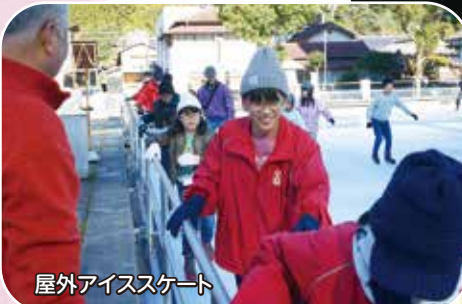
屋外アイススケート

夏には、耶馬溪ダムでの水上スポーツや、一目八景で水遊びもできるそうです。今度は夏の中津で遊びたいですね♪