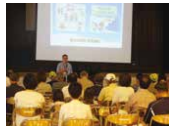
防犯防災活動勉強会

国分小校区自治協議会の防犯防災委員会では、各自治会での防犯パトロールを継続するとともに、月一回の会議終了後に校区内を巡回するパトロールを行っています。また、国分小校区全体で通学路の見守りを行っています。さらに、毎年国分小学校で地域の人を対象とした防犯や防災についての勉強会を開催し、身に付けておくべき知識や情報をお伝えしています。