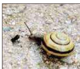
太宰府市民遺産パネル展