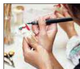
木うそ絵付け体験