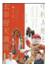
「中村人形と太宰府天満宮」