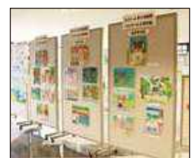
第3回 だざいふ子ども絵画展