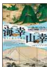
特別展 海幸山幸 -祈りと恵みの風景-