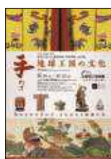
特集展示 琉球王国文化遺産集積・ 再興事業 巡回展 手わざ - 琉球王国の文化 -