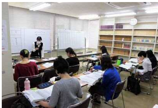
◆医療事務講座 (事業番号41資格・技能・技術取得への支援)