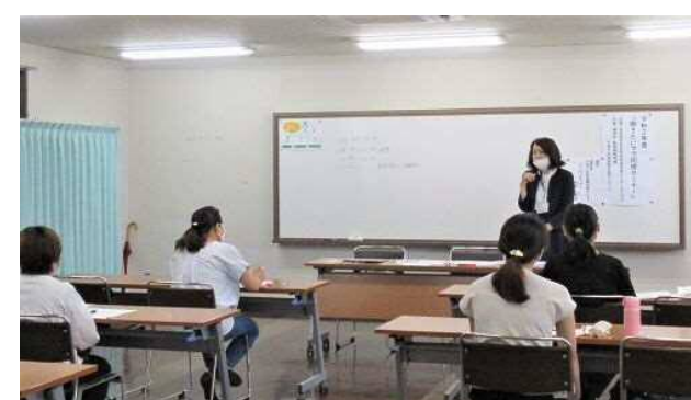
◆働きたいママ応援セミナー (事業番号43再就職支援講座の実施)