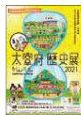
まるごと太宰府 歴史展2021