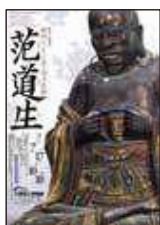
特集展示 没後350年記念 明国からやって来た奇才仏師 范道生