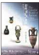
特集展示 古代ガラスの世界 — 岡山市立オリエント 美術館蔵品展 —