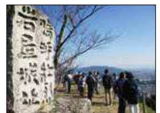
四王寺山史跡散策登山