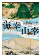
特別展 海幸山幸 -祈りと恵みの風景-