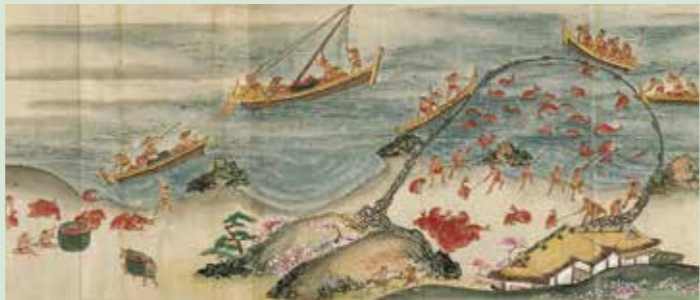
佐賀県重要文化財「肥前国産物図考」第六帖(部分) 江戸時代・18～19世紀、佐賀県立博物館。原本は木崎盛標筆。会期中、展示する場面の入れ替えがあります。

海に囲まれ山林の多い日本では、古くから海と山からの恵みによって豊かな暮らしを営んできました。10月9日(土)から開催する特別展「海幸山幸」では、海と山に関わるさまざまな作品をとおして、日本人が自然との共生のなかで育んできた歴史と文化を紹介しします。