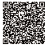
▲よかもん市場 (インターネット通販)