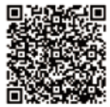
▲通販・取扱書店 (調査統計課ホームページ)