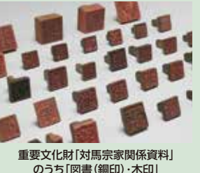
重要文化財「対馬宗家関係資料」のうち「図書(銅印)・木印」

4階文化交流展示室では、これらのハンコを入れ替えながら展示しています。二セモノだからといって価値がない訳ではありません。むしろ、これらの二セモノは、外交知識や技術を活かして激動の時代を生きた対馬のしたたかな戦略を物語る、歴史の証人なのです。