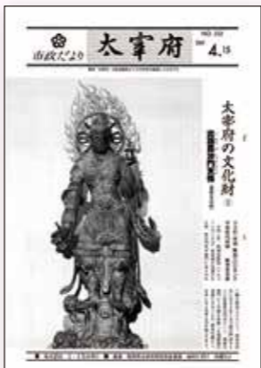
【第332号:昭和60年4月15日】 この第332号から、現在も続く「太宰府の文化財」の連載が始まりました。当時は毎月1日と15日の月2回発行していた広報誌の15日号の表紙を飾っていました。この連載も今回で436回を迎え、毎回交代で文化財課職員が心を込めて執筆しています。