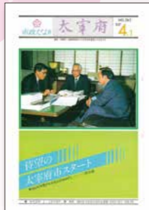
【第262号:昭和57年4月1日】 市制施行により現在の太宰府市となって初の広報紙は、字体は引継ぎながら「市政だより太宰府」として発行されました。表紙には初代三役が会議を行う様子が掲載されました。