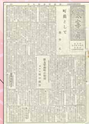
【第1号:昭和30年8月10日】 太宰府町と水城村が合併し、公民館組織や発行体制を整えながら第1号は発行されました。全6ページでスタートした広報紙。当時の人口13,264人の住民の方へ新「太宰府町」の情報が届けられました。