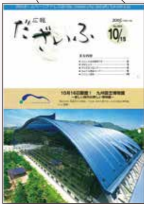
【第804号:平成17年10月15日】 平成15年5月1日号からは表紙のデザインを一新しました。これ以降、表紙以外の記事もカラー化が進みましたが、現在のようにすべてのページをカラーにしたのは1000号の歴史の中でもごく最近のことです。