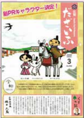
【第982号:令和2年3月1日】 平成31年1月1日号から、現在の表紙デザインを採用。内容の伝わりやすさを心がける一方で、最近では新型コロナウイルスワクチンに関する記事のように、編集時点での情報が市民の皆さんに届くまでに変わってしまう可能性がある内容も増えてきています。ホームページやSNSなどでの速報性との役割分担を図りながら、紙媒体ならではのあたたかみを追求していきます。