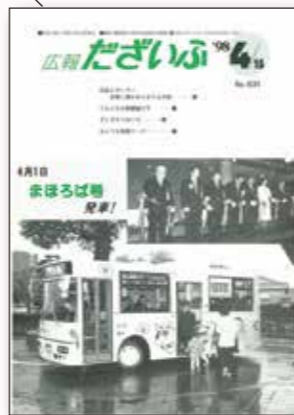
【第631号:平成10年4月15日】 平成9年5月1日号から現在の「広報だざいふ」として発行しています。記事の主な項目はこの頃までに確立され、その多くが現在まで掲載されています。また、その時の市政を伝えるニュースが表紙を飾るようになり、記事としての側面を表紙も持つようになってきました。まほろば号の運行開始を伝えるのもその一つです。