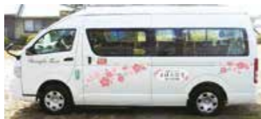
まほろば号地域線

「まほろば号地域線」の運行状況や忘れ物に関する問い合わせ 有限会社太宰府タクシー ☎(9225)8855