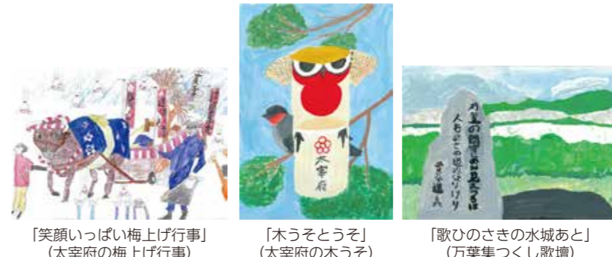
「笑顔いっぱい梅上げ行事」(太宰府の梅上げ行事)