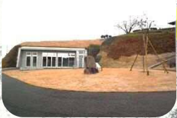
平成29年4月1日にオープンした市の便益施設。休憩スペースや展示スペースなどがありますよ♪