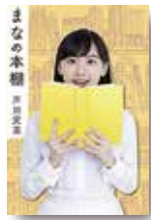
『まなの本棚』 芦田愛菜/著 小学館