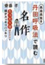
『長息長生き丹田呼吸法 で読む名作』 齋藤孝/著 岩崎書店