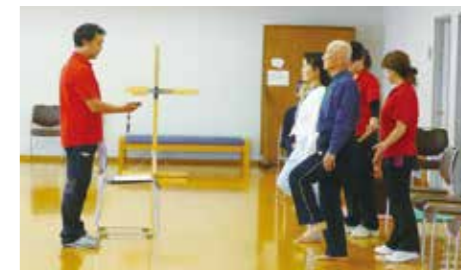
転ばんための体力測定

介護予防に大切な、体力や食事、認知症などについてチェックを行います。チェック結果の説明やオススメの運動も紹介します。元気な生活を送るための「転ばぬ先の杖」を手に入れましょう。