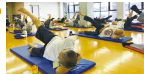
男性のためのすこやか運動教室

自分に合った難易度で、音楽に合わせて軽い運動を行います。どなたでも参加できるものと、参加の少ない男性のみを対象としたものがあります。