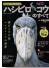
『ハシビロコウのすべて』 今泉忠明/監修 廣済堂出版