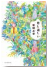
『待ち遠しい』 柴崎友香/著 毎日新聞出版