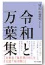
『令和と万葉集』 村田右富実/著 西日本出版社