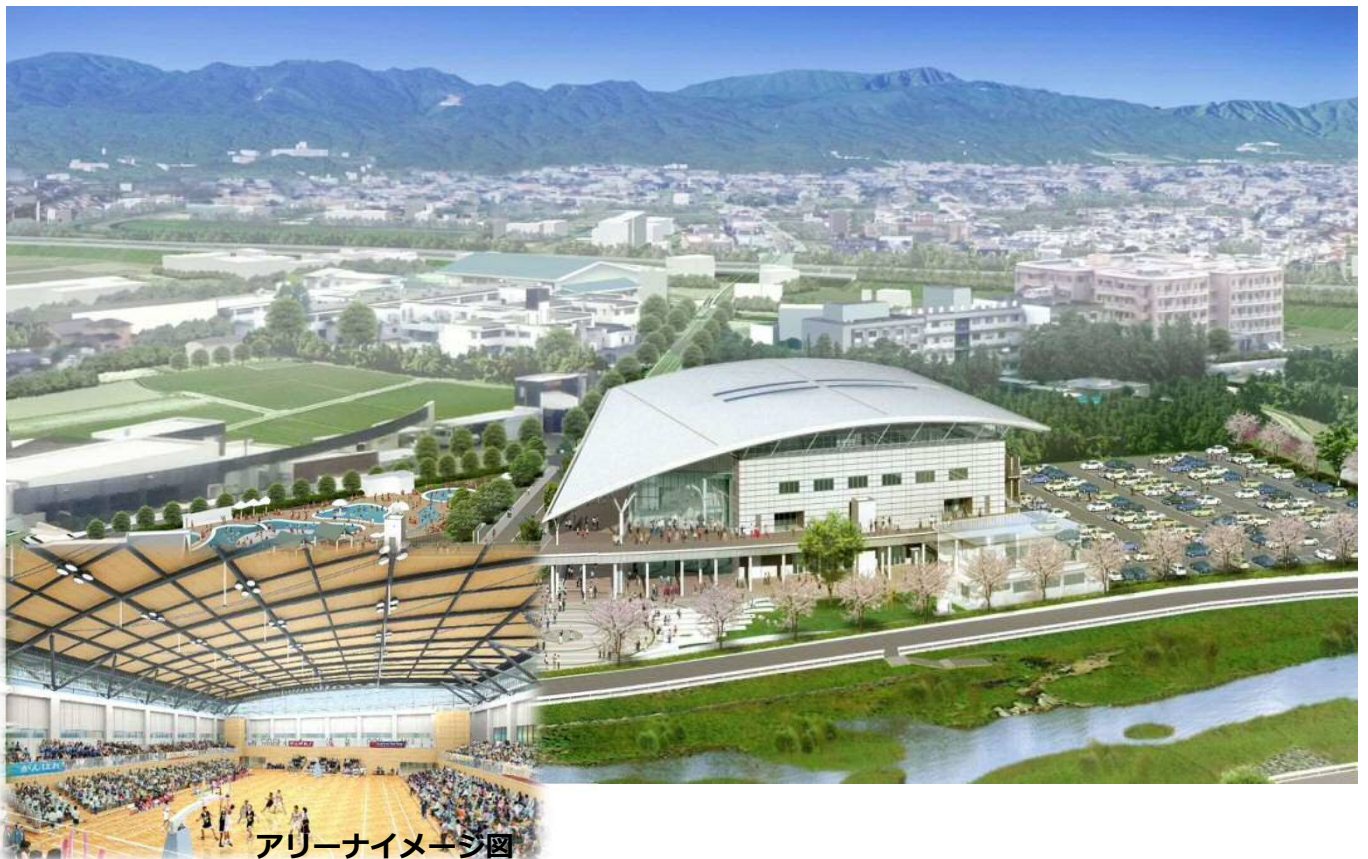
アリーナイメージ図