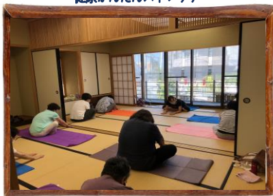
健康かんたんストレッチ