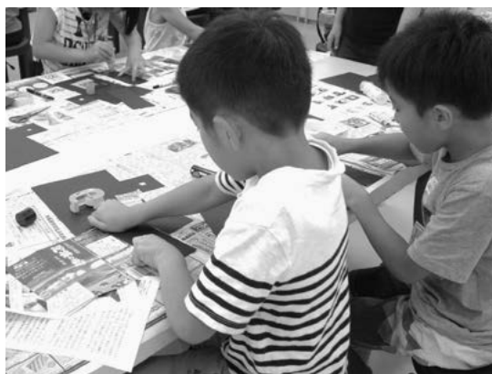
6ページ 箱カメラを作ってみよう講座

■乳幼児と保護者の講座・事業は18～20ページの保育・教育のコーナーもご覧ください。