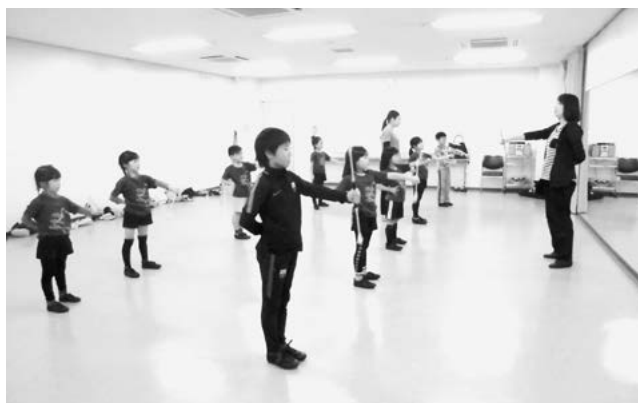
5ページ バトントワリング

※問い合わせ先が市内の大学になっている催しについて、詳しくは、「キャンパスネット情報」Vol.38 (2018春号) をご覧ください。