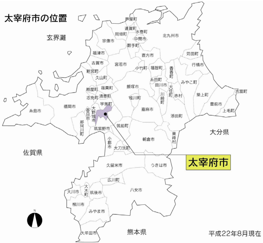
図 太宰府市の位置