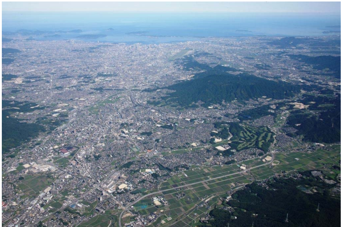
(太宰府市上空から博多湾、玄界灘を望む)