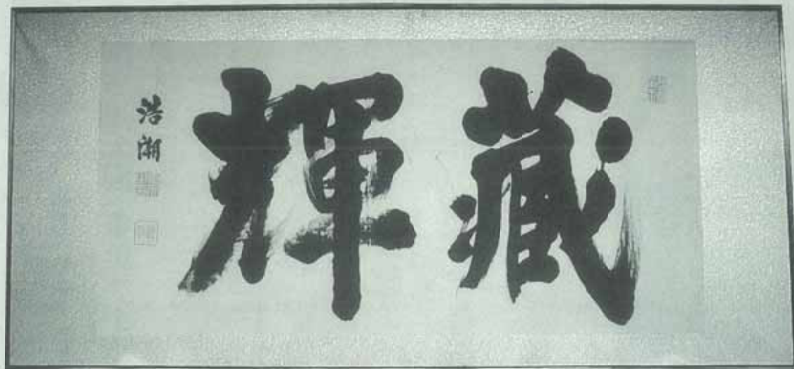
縦82センチ 横177センチ JA筑紫所蔵