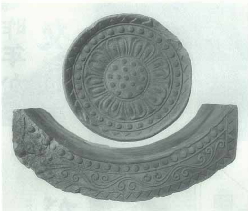
老司 I 式 軒瓦

昨秋の台風で屋根瓦を飛ばされ、困ったお宅も多いと存じますが、今回はその貴重な瓦の話です。瓦の作り方は日本では六世紀末に朝鮮半島の百濟から伝えられました。初めは瓦葺きの建物はお寺ぐらいでしたが、奈良や京都に都が造られ始めると、宮殿や重要な