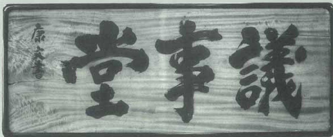
縦71センチ 横177センチ 太宰府市所蔵

■毎月2回/1・15日発行 ■編集/福岡県太宰府市総務部企画課 TEL (092)921-2121 内線513・514